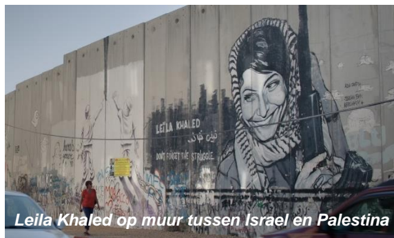
Leila Khaled op muur tussen Israël en Palestina

In de eerste aflevering trekt Phara naar Israël en Palestina. Ze praat er met drie generaties vrouwen die strijden in een decennia oud conflict tussen de mensen die in beide gebieden wonen.