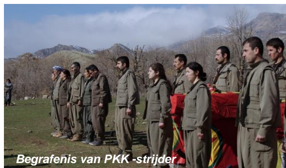
Begravenis van PKK-strijder