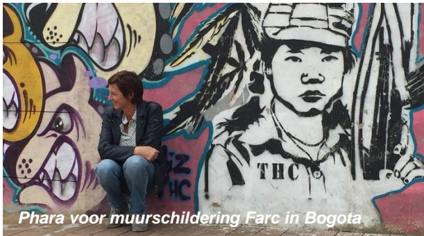
Phara voor muurschildering Farc in Bogota