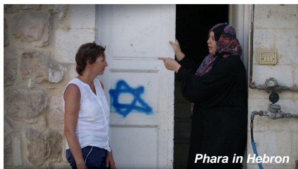
Phara in Hebron