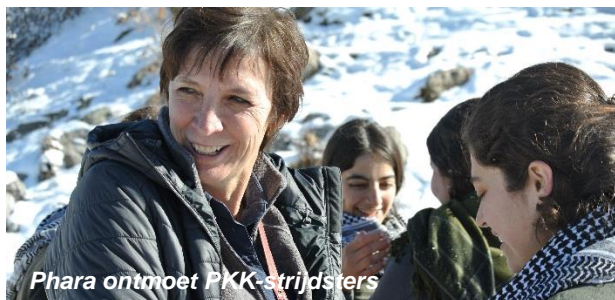
Phara ontmoet PKK-strijdsters